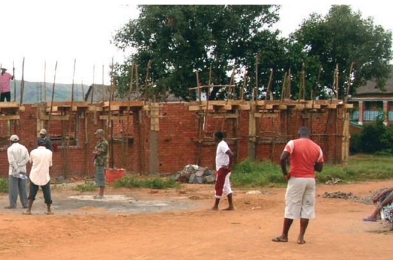
Construction de salles de classes / Cours d'alphabétisation (Doria, janvier 2014)

Budget: 141'866 CHF. Le projet a bénéficié du soutien de la Fédération genevoise de coopération ( www.fgc.ch ) qui a financé l'ensemble des activités mises en œuvre.