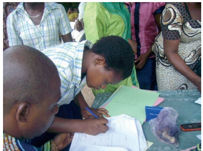
Signature de contrat pour les diplômés : guide touristique et couturière (ASDEB, 2013)