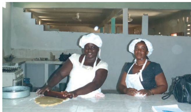
Formations aux métiers du bâtiment et de la pâtisserie (APPEL, juin 2013)