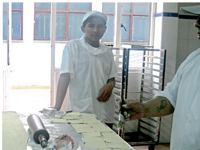
Ateliers de fabrication de jouets et de pâtisserie (Apoyar, mars 2014)