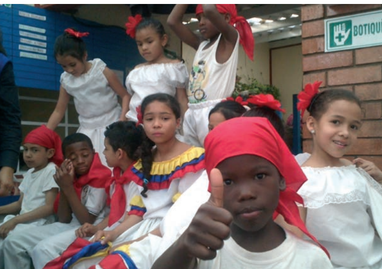
Intégration des jeunes afro-colombiens et populations métis (Mascarada, mai 2013)

Budget: 58'312 CHF. Le projet a bénéficié du soutien de la Fédération genevoise de coopération ( www.fgc.ch ) qui a financé l'ensemble des activités mises en œuvre.