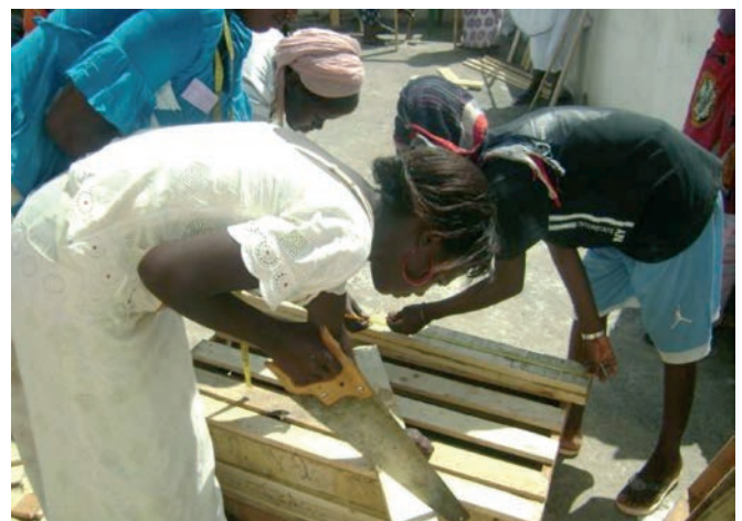
Cours de menuiserie (EPE, juin 2013)