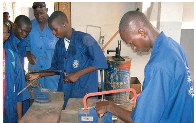
Formation en TIC et en menuiserie métallique (AJA, mars 2013)