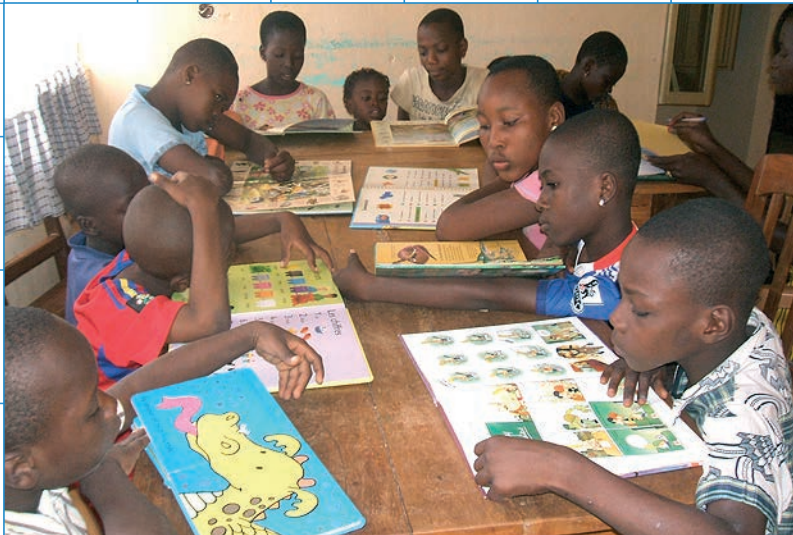
Salle de lecture pour les orphelins et enfants vulnérables (FDD, 2013)

AccEd - Association pour l'accès à l'éducation et à la formation Avenue des Tilleuls 3 • 1203 Genève • Tél. +41 22 940 02 80 e-mail: info@acced.ch • site internet: http://www.acced.ch