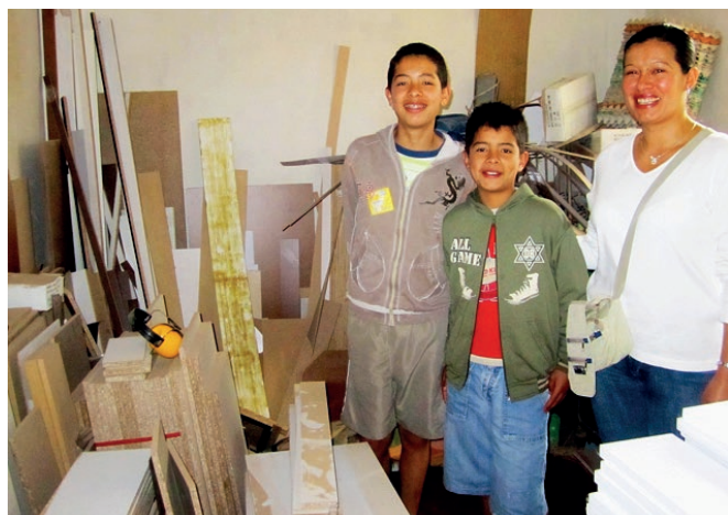
Ateliers de fabrication de jouets (Apoyar, mars 2014)