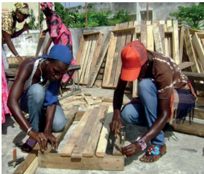
Cours de menuiserie (EPE, juin 2013)

Budget: 93'000 CHF. Le projet a bénéficié du soutien de la Fédération genevoise de coopération (www.fgc.ch), de Hope for African Children Initiative et de l'American Jewish World Service qui ont financé l'ensemble des activités mises en œuvre.