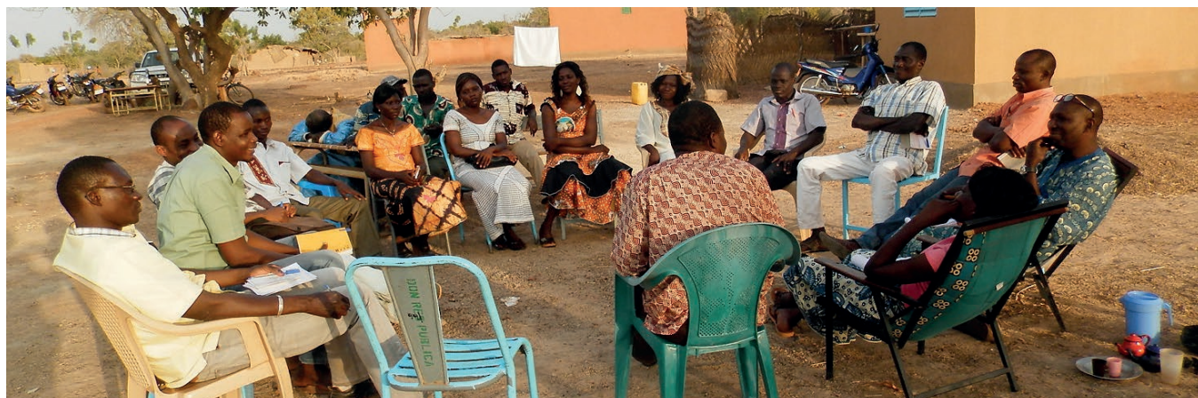
Réunion corps enseignant de Kalwaka Mara (Songui Manegre, janvier 2014)

Budget: 38'000 CHF. Le projet a bénéficié du soutien de la Fédération genevoise de coopération ( www.fgc.ch ) qui a financé l'ensemble des activités mises en œuvre.