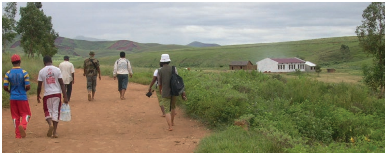
Construction de salles de classes (Doria, janvier 2014)

Budget: 77'000 CHF. Le projet a bénéficié du soutien de la Fédération genevoise de coopération ( www.fgc.ch ) qui a financé l'ensemble des activités mises en œuvre.