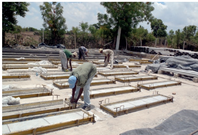
Formations aux métiers du bâtiment et de la pâtisserie (APPEL, juin 2013)

d'événements socioculturels organisés à l'échelle régionale : fêtes patronales, salons du livre, fêtes de fin d'année, etc.