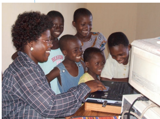
Mise en confiance par l'initiation à l'informatique (FDD, Togo)